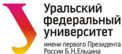
Уральский федеральный университет